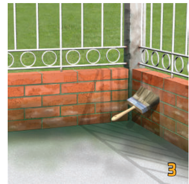
Thi công lớp thứ nhất Sikagard®-905 W bằng cọ hay rulo