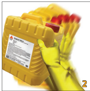
Lắc đều bình sản phẩm Sikagard®-905 W trước khi thi công.