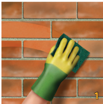
Vệ sinh và làm khô bề mặt