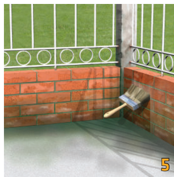
Thi công lớp thứ hai Sikagard®-905 W