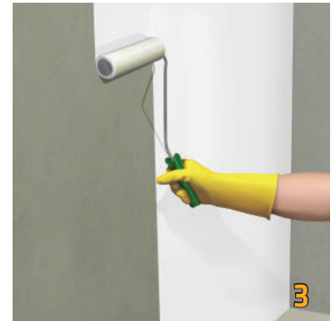
Thi công lớp thứ nhất Sika® RainTite bằng cọ hay rulo