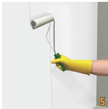
Thi công lớp thứ hai Sika® RainTite