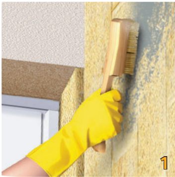
Vệ sinh và làm khô bề mặt tường