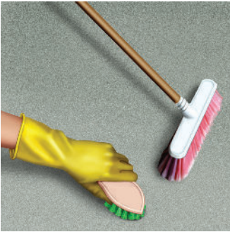
Vệ sinh sạch bề mặt nền trước khi dán gạch