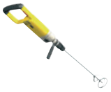
Máy trộn điện tốc độ chậm