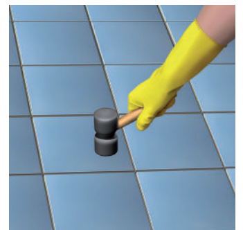
Dùng tay hoặc búa cao su để ấn nhẹ, điều chỉnh viên gạch vào vị trí và đảm bảo vữa phủ đều lên bề mặt viên gạch