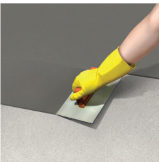
Dùng bay trét vữa lên nền