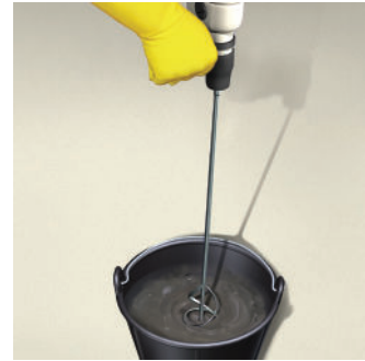
Trộn cho đến khi hỗn hợp đồng nhất, nhuyễn, không vón cục (sau khi trộn nhuyễn, ngưng lại vài phút rồi trộn lại trước khi thi công)