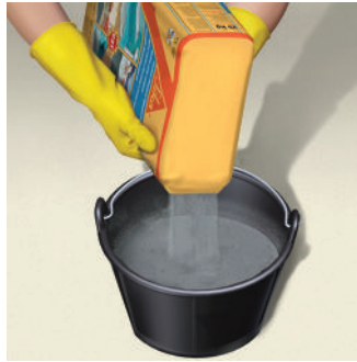
Cho nước sạch vào xô, từ từ cho phần bột vào trộn đều theo tỉ lệ 5 kg Sika® Tilebond GP với 1 lít nước