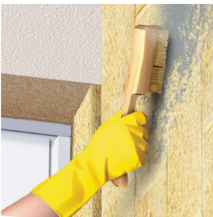
Bước 1: Vệ sinh, xử lý bề mặt bê tông, vữa