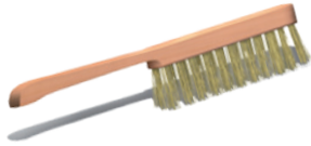
Bàn chải sắt